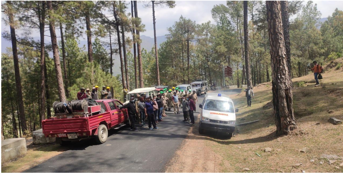
टोन्स वन प्रभाग, पुरोला अन्तर्गत जरमोला के पास पास घटित वनाग्नि मॉक अभ्यास फोटोग्राफ