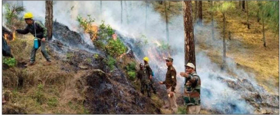
फायर मॉक ड्रिल के दौरान जंगलों की आग बुझाते वनकर्मी।