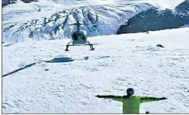
उत्तरकाशी के द्रौपदी का डांडा क्षेत्र में लापता पर्वतारोहियों की तलाश में हेलीकॉप्टर से पहुंचा बचाव दल ।