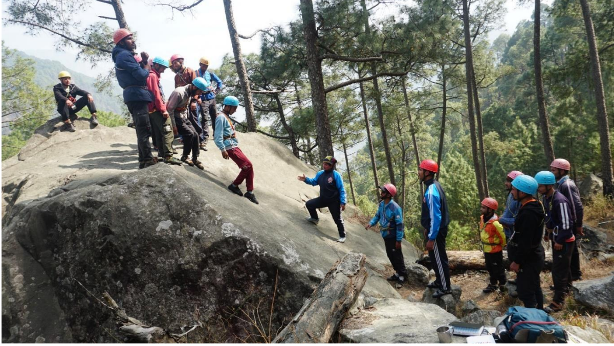
रॉक पर सुरक्षित चढ़ना एवं उतरने की विधि का अभ्यास ।