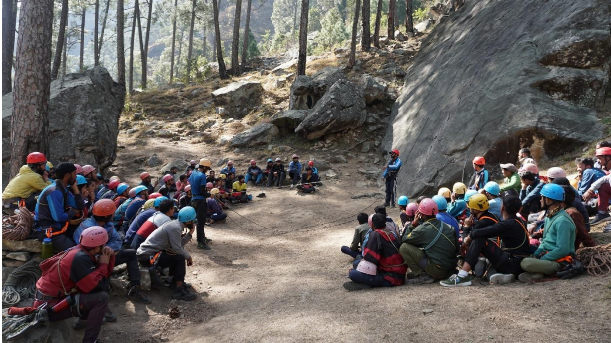
निम प्रशिक्षकों द्वारा तेखला रॉक क्लाइंबिंग क्षेत्र में खोज एवं बचाव का प्रशिक्षण प्रदान करते हुये ।