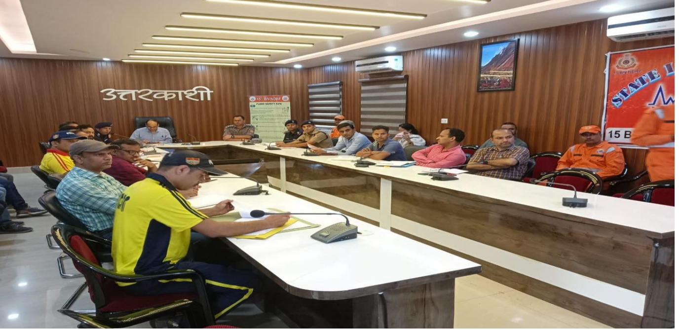
मॉक अभ्यास पूर्व तैयारी बैठक।