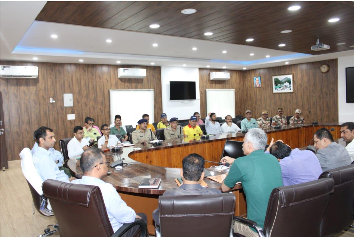
मॉक अभ्यास के बाद विभिन्न विभागों के साथ डि-ब्रिफिंग करते हुये जिलाधिकारी ।