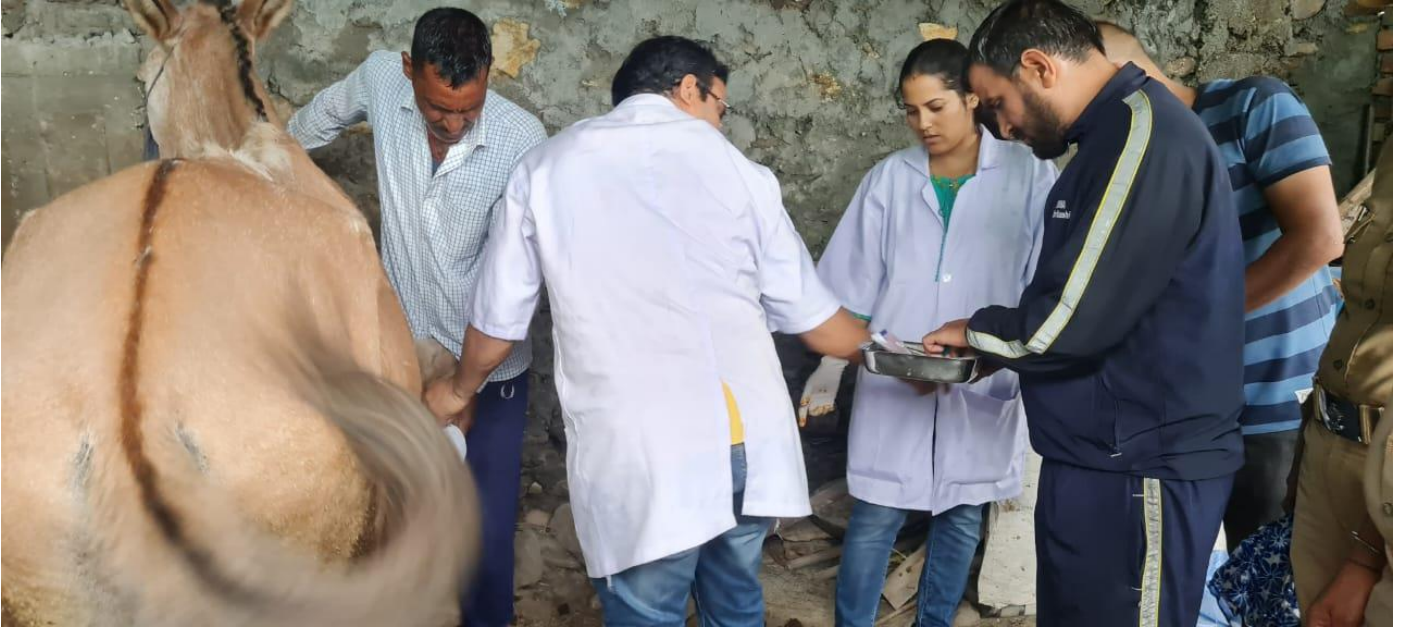
त्वरित बाढ़ के दौरान घयल पशुओं का उपचार करते हुये पशुचिकित्साधिकारी ।