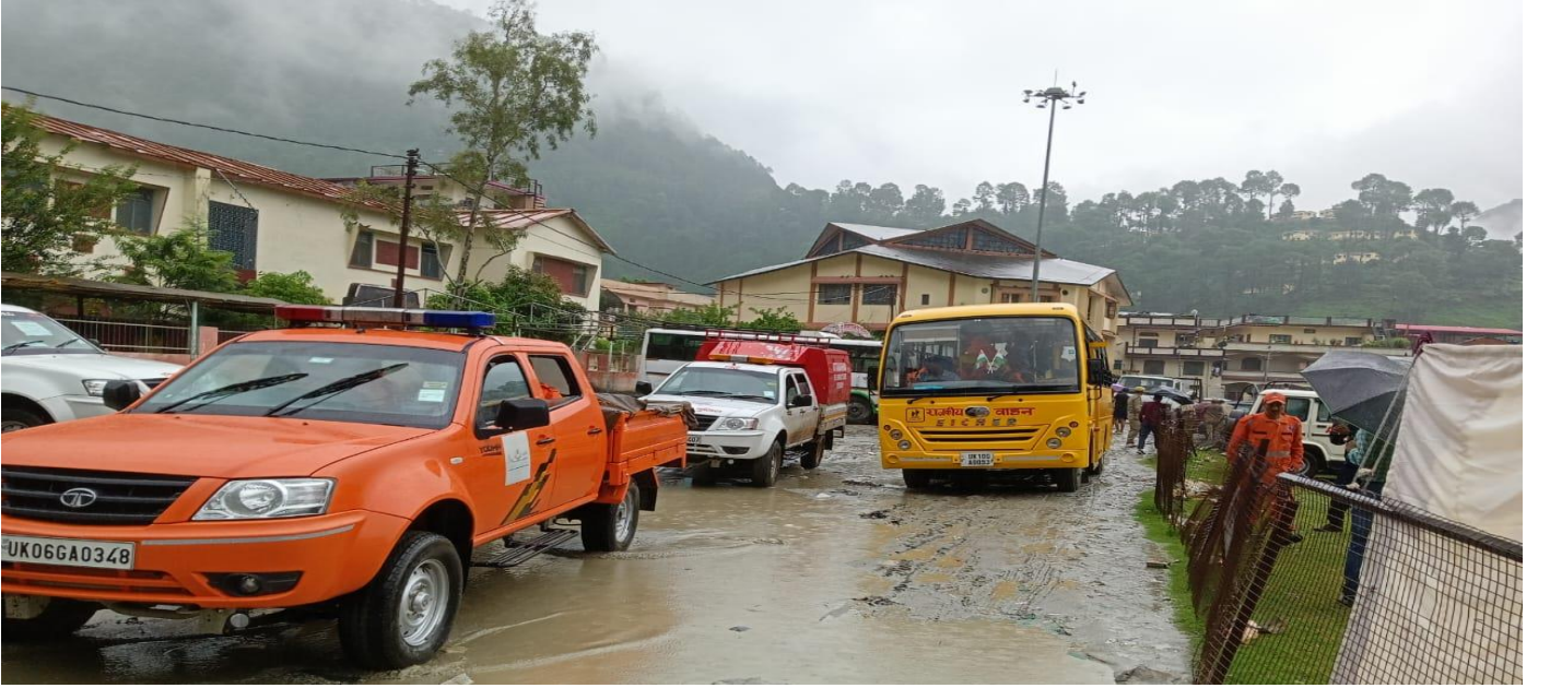
स्टेजिंग एरिया से घटना स्थल हेतु जाते हुये वाहन।