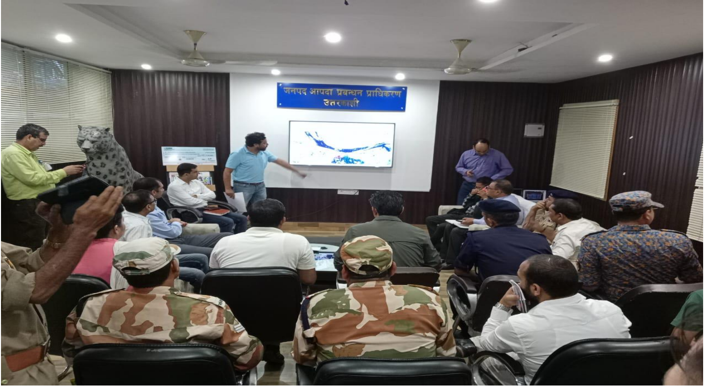
इंसीडेन्ट कमांडर एवं अन्य अधिकारियों को घटनाक्रम के विषय में जानकारी प्रदान करते हुये।