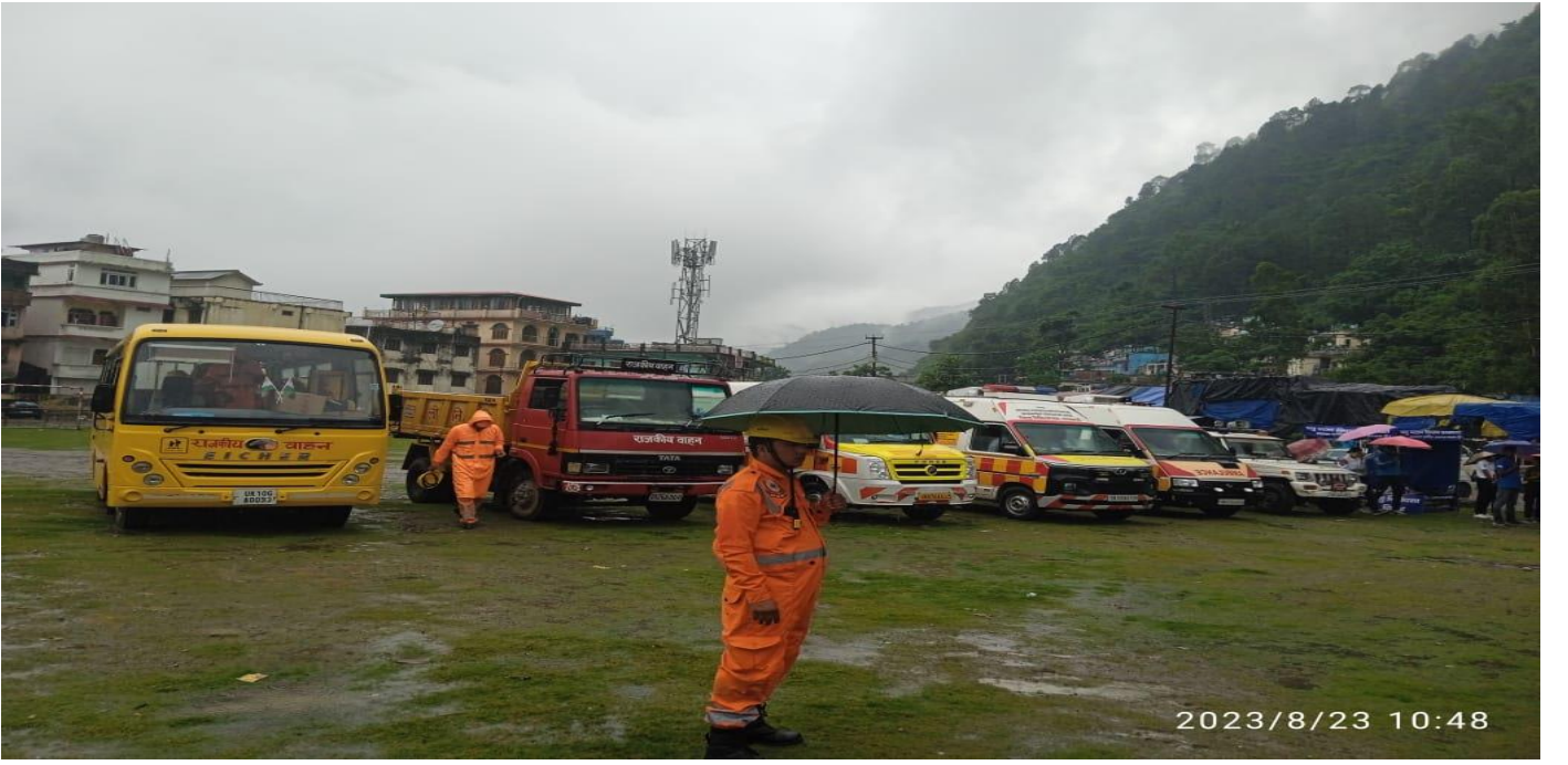
स्टेजिंग एरिया में खडे वाहन (रिर्सास)