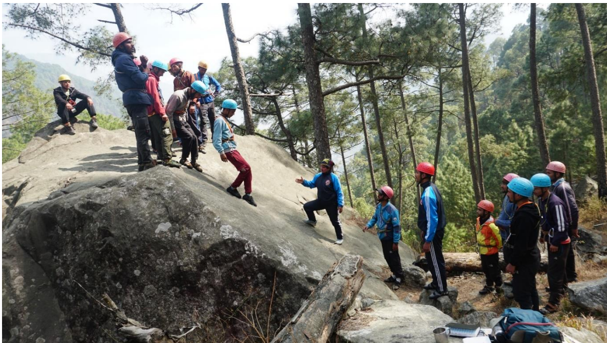
रॉक पर सुरक्षित चढ़ना एवं उतरने की विधि का अभ्यास ।