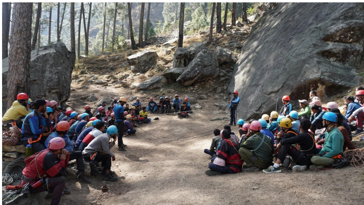
निम प्रशिक्षकों द्वारा तेखला रॉक क्लाइंबिंग क्षेत्र में खोज एवं बचाव का प्रशिक्षण प्रदान करते हुये ।